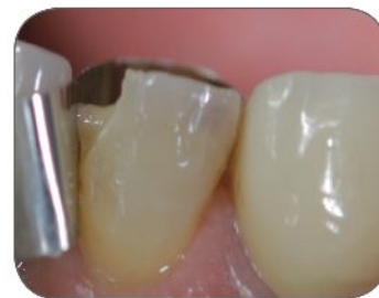
⑥ Aplikácia Reflectys, opačného kompozitu na palatálnej strane, po vytvrdení svetlom sa aplikuje Reflectys, bežný priesvitný odtieň