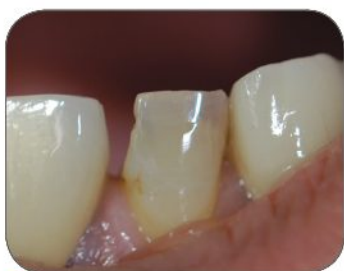
① Pohľad pred zákrokom znázorňujúci stratu hmoty