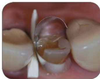
⑤ Umiestnenie matrice a dreveného medzizubného kliniku, aby sa zabezpečil dobrý medziálny kontakt