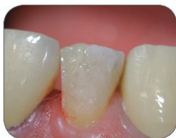
⑧ Pohľad na surový kompozitný materiál po odstránení matrice