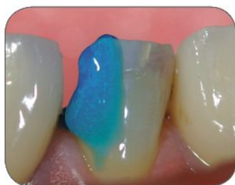
② Plné leptanie pomocou DentoEtch a 37% kyseliny fosforečnej