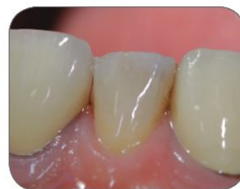
⑨ Záverečný pohľad po leštení silikónovými diskami Perfect Polish