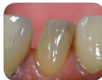
③ Aplikácia Iperbond Ultra, lepidla enamel-dentínu